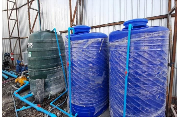
รูปที่ 31 ถังสำรองน้ำใช้