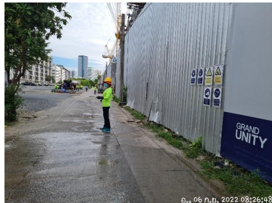
รูปที่ 23 ฉีดพรมน้ำบริเวณพื้นที่โครงการ