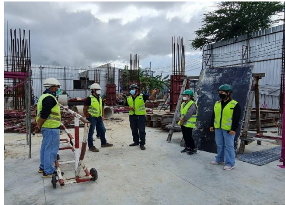
รูปที่ 26 หัวหน้าคนงาน