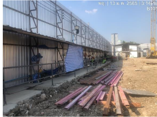
รูปที่ 20 ทางเดินปลอดภัยภายในโครงการ (ปัจจุบันรื้อถอนออกแล้ว)