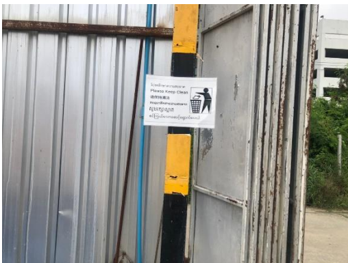
รูปที่ 32 ป้ายกำกับการทิ้งขยะ