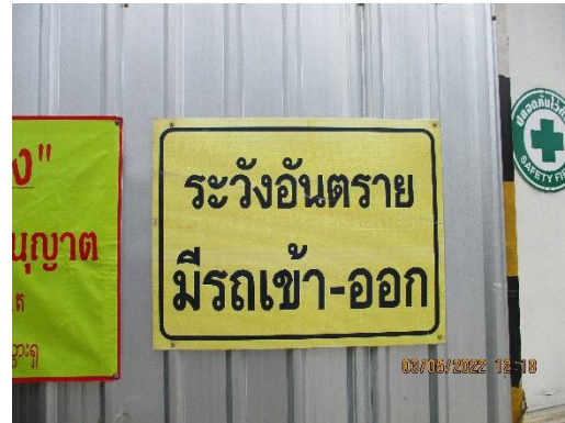
รูปที่ 2 ป้ายแสดงเขตพื้นที่ก่อสร้าง