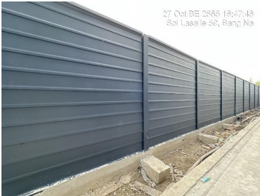
รูปที่ 1 รั้วถาวร