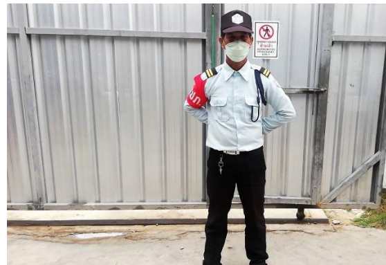
รูปที่ 22 เจ้าหน้าที่รักษาความปลอดภัยประจำโครงการ (รปภ.)