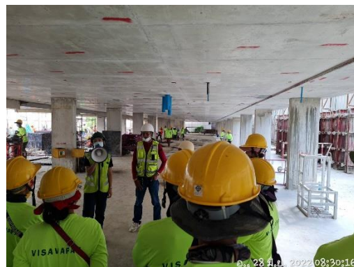
รูปที่ 38 กิจกรรม Safety Talk