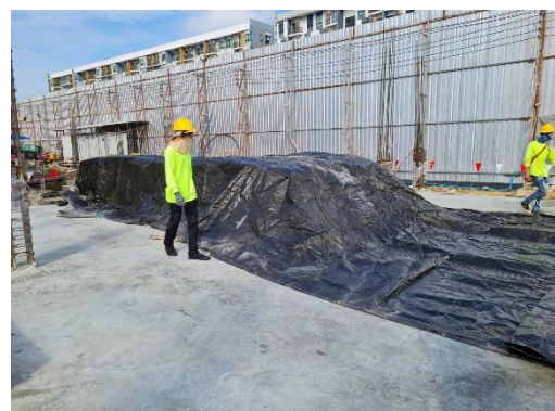
รูปที่ 25 พื้นที่สำหรับเก็บกองวัสดุก่อสร้าง