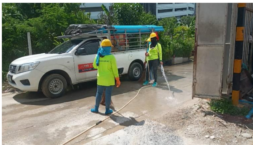
รูปที่ 24 จุดล้างล้อรถ