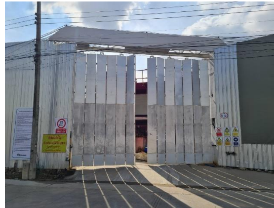
รูปที่ 40 ป้ายจำกัดความเร็ว (ปัจจุบันรื้อถอนออกแล้ว)