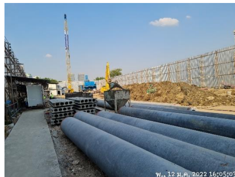
รูปที่ 27 การเจาะเสาเข็มแบบ Jack in Pile