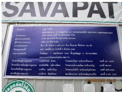
รูปที่ 12 ป้ายแสดงรายละเอียดของโครงการ