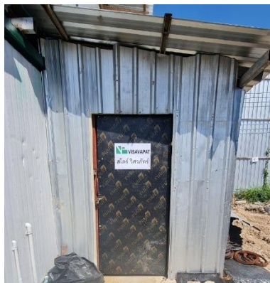
รูปที่ 8 ห้องส้วม