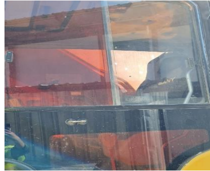
รูปที่ 35 ที่นั่งสำหรับรถขุดเจาะที่รองด้วยวัสดุป้องกันความสั่นสะเทือน