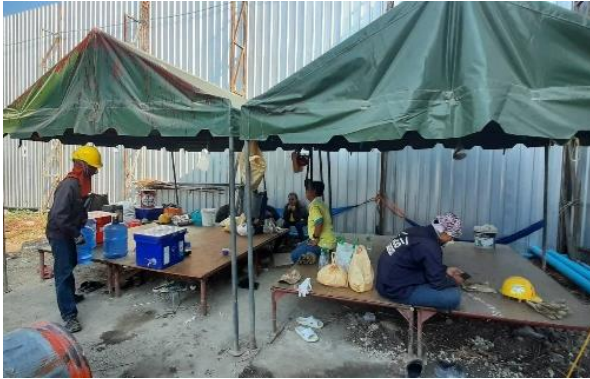
รูปที่ 19 พื้นที่สำหรับนั่งพักของพนักงาน (ปัจจุบันรื้อถอนออกแล้ว)