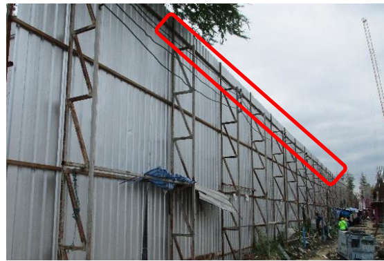
รูปที่ 5 ฉีดพรมน้ำบริเวณพื้นที่โครงการ/สเปรย์น้ำบริเวณแนวรั้วชั่วคราว