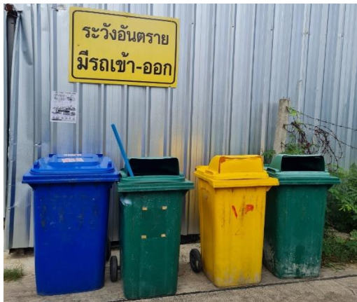
รูปที่ 10 ถังรองรับมูลฝอย