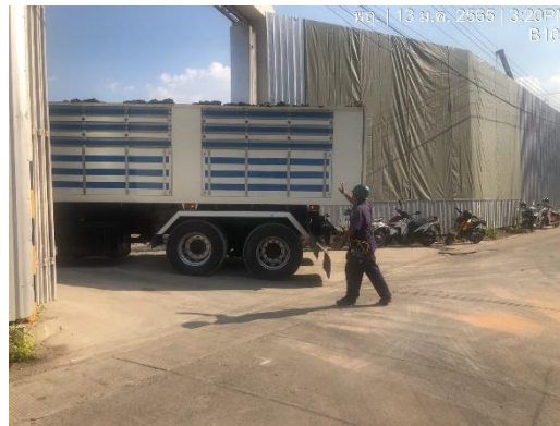
รูปที่ 21 เจ้าหน้าที่รักษาความปลอดภัยคอยอำนวยความสะดวก