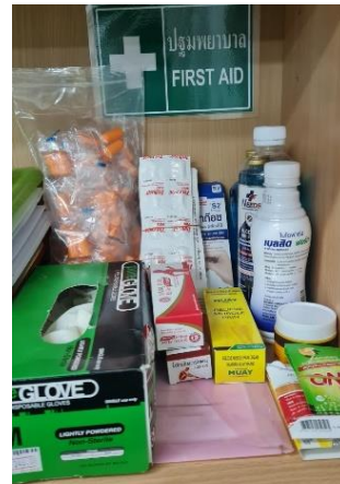
รูปที่ 37 อุปกรณ์ปฐมพยาบาลเบื้องต้น