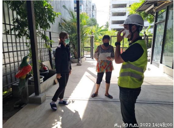
รูปที่ 28 เจ้าหน้าที่โครงการเข้าพบปะบ้านข้างเคียง