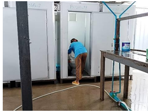
รูปที่ 29 การทำความสะอาดห้องน้ำห้องส้วม