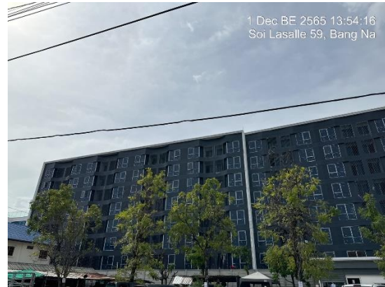
รูปที่ 7 สภาพพื้นที่โครงการปัจจุบัน (เดือนกรกฎาคม ถึงธันวาคม พ.ศ.2565)