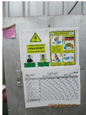
รูปที่ 6 ตู้ไฟฟ้า