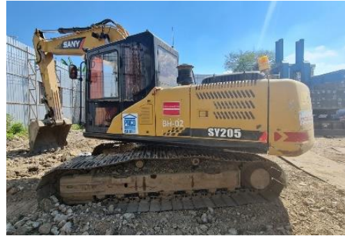
รูปที่ 26 ป้ายไม่เดินเครื่องจักรขณะไม่ใช้งาน