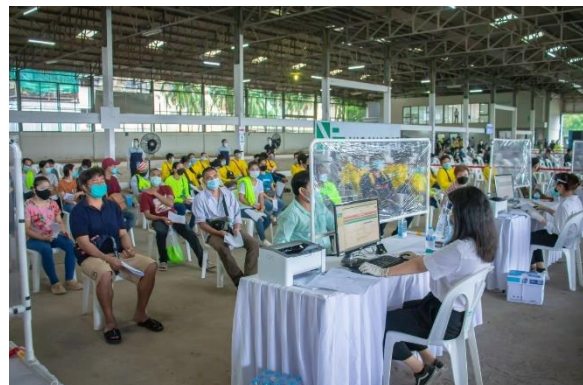
รูปที่ 33 ตรวจสอบสุขภาพคนงาน