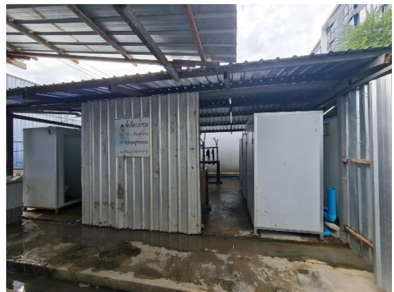
รูปที่ 9 ห้องน้ำ/ห้องส้วม