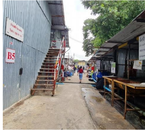
รูปที่ 39 บ้านพักคนงานก่อสร้าง