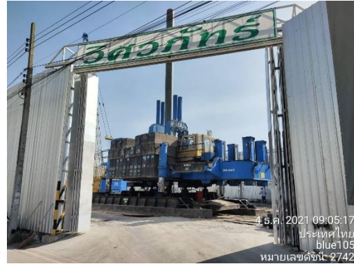
รูปที่ 4 ประตูทางเข้า-ออกโครงการ