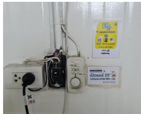
รูปที่ 30 ป้ายรณรงค์ประหยัดน้ำ ประหยัดไฟ