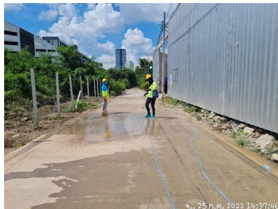
รูปที่ 3 คนงานทำความสะอาดภายในโครงการและภายนอกโครงการ