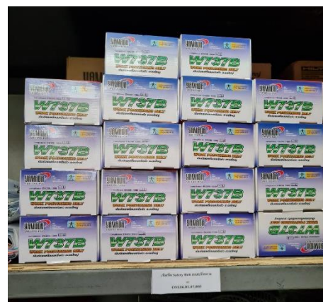
รูปที่ 34 อุปกรณ์ป้องกันอันตรายส่วนบุคคล (PPE)