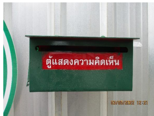
รูปที่ 13 กล่องรับเรื่องร้องเรียน