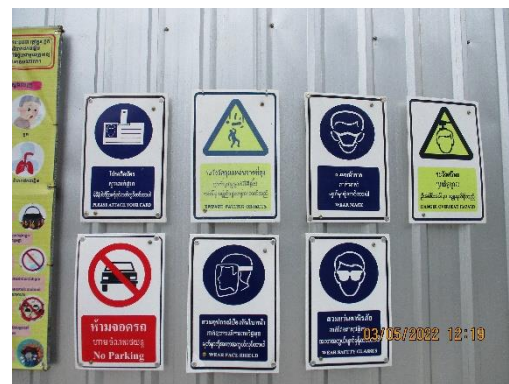
รูปที่ 11 ป้ายเตือนความปลอดภัย