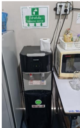
รูปที่ 36 น้ำดื่มสะอาดป้ายกำกับการทิ้งขยะ